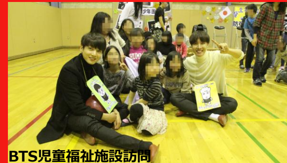
BTS児童福祉施設訪問