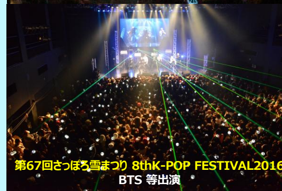
第67回さっぽろ雪まつり 8th K-POP FESTIVAL 2016 BTS 等出演