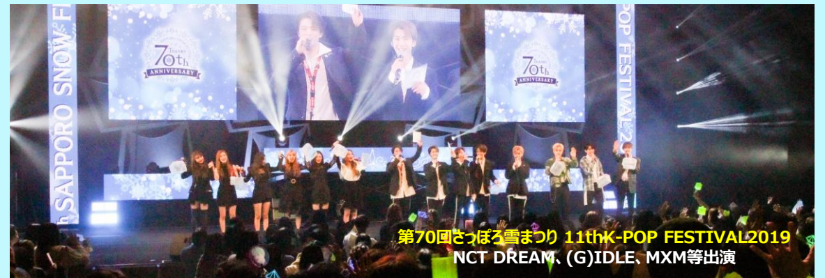
第70回さっぽろ雪まつり 11th K-POP FESTIVAL 2019 NCT DREAM、(G)IDLE、MXM等出演

音楽とGFSCチャリティーを通じて日韓文化交流の架け橋となるべく、 話題のK-POPアーティストとともに、世界三大雪まつりの一つ 『さっぽろ雪まつり』を2009年から継続的に盛り上げている超プレミアムK-POP音楽祭です。またGFSCチャリティー活動の一環として、 出演アーティストによる児童福祉施設訪問を行い、子どもたちへ夢 と希望を届ける温かな交流を実施しています。さらに、児童福祉 施設の子どもたちを公演に特別招待しています。