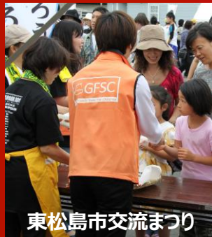
東松島市交流まつり