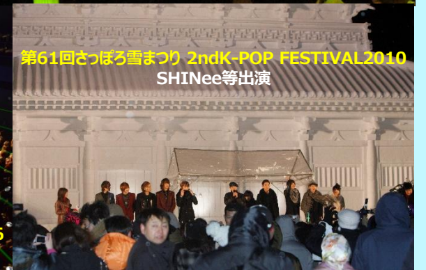
第61回さっぽろ雪まつり 2nd K-POP FESTIVAL 2010 SHINee等出演