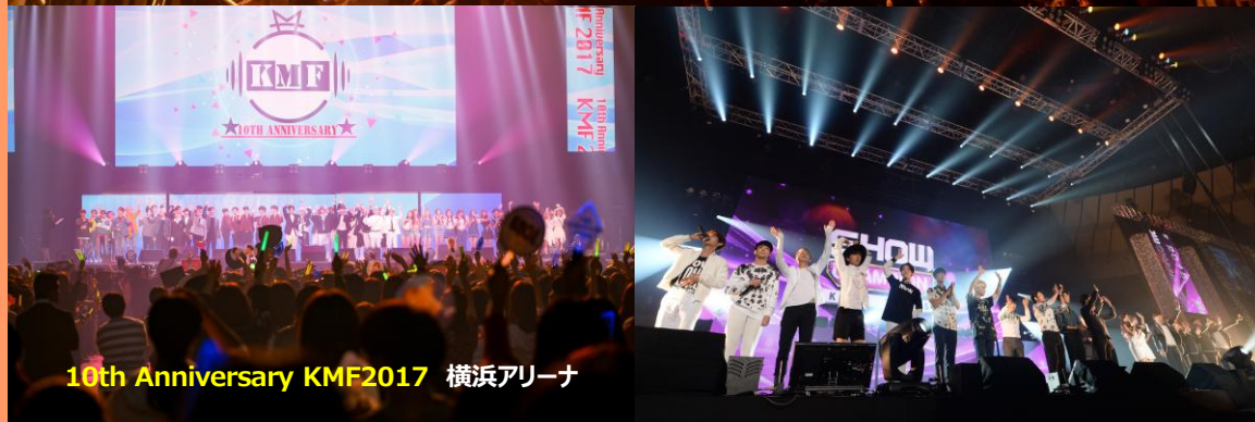
10th Anniversary KMF2017 横浜アリーナ

K-POPで唯一17年間続く「さっぽろ雪まつり公式協賛行事」で韓国を代表するK-POPスターが多数出演！ アーティストからも“一度は出演してみたい！”と言われる日本の冬を代表する憧れのブランド公演へと成長