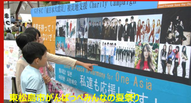
東松島市がんばっぺみんなの夏祭り