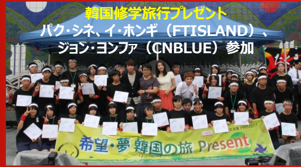
韓国修学旅行プレゼント パク・シネ、イ・ホンギ (FTISLAND)、 ジョン・ヨンファ (CNBLUE) 参加