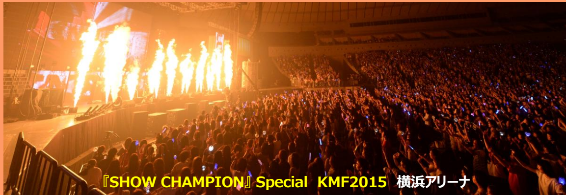
『SHOW CHAMPION』Special KMF2015 横浜アリーナ

“LOVEKMF!”というスローガンのもと、16年にわたり多くのファンを魅了してきた、日本 最高の伝統を誇る秋のK-POP音楽祭。新人スターを数多く発掘し、日本の音楽ファン にいち早く紹介してきたことから、K-POP最強“新人登竜門”として知られてきました。 BTSは『KMF2015』、NCT 127&NCT DREAMは『KMF2017』（横浜アリーナ） に出演し、NCT DREAMは『KMF2019』にも出演、成長した姿で観客を魅了しました。 NPO日韓創立20周年記念『Final 16th KMF2024』（横浜アリーナ）では、特別学生 応援席を設けるとともに関係団体と連携し、さまざまな事情を抱える子どもたちを招待しました。