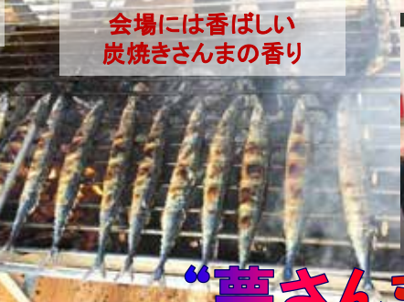
会場には香ばしい炭焼きさんまの香り