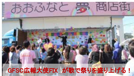
GFSC広報大使FIX が歌で祭りを盛り上げる！