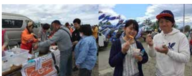
韓国おでんとおなじみになったトッポッキ。「今年も楽しみに来ました！」とのトッポッキファンの方も嬉しい再会。