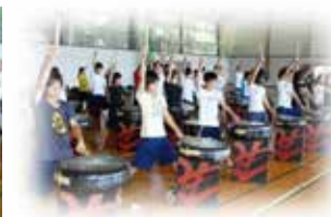
古タイヤで太鼓を練習する生徒たち

2011.7.22 当法人と雄勝中学校、地元支援団体と三者による希望の和太鼓プロジェクト復興支援調印を取り交わし、まずは和太鼓贈呈、和太鼓ワークショップを通して、太鼓を打ちながら子供達の心が癒され、 たくましく生きよ！ というキャッチフレーズで子供たちの心のケアと町復興、そして日韓交流を通し大震災のトラウマを乗り越える支援活動を開始した。(参考までに宮城県石巻地域は日本植民地時代韓国の若者たちの恩人のイ・クオン弁護士のご郷である)