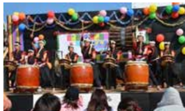
当法人が3年間支援してきた宮城県石巻市雄勝中学校の復興太鼓。片道3時間を掛けての遠征応援。たくましくなった姿で叩く太鼓演奏の音がこだまする！