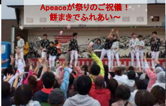
Apeaceが祭りのご祝儀！ 餅まきでふれあい～

和太鼓とDJ、和声ボイスで構成される若者グループ SAMURAI APARTMENTO