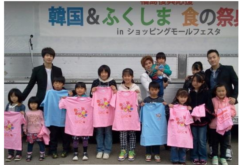
踊る子供の姿こそ福島希望

GFSC 広報大使として‘FIX’が福島復興祭りで企画された「ふくしま & 韓国・食の祭典2013」に参加してチャリティ公演をし、郡山の人たちを魅了しました。今回の祭典は食を中心して日韓文化交流と福島の食の安全性を対外にアピールする目的で、郡山に避難している被災地の住民たちも多数参加しました。郡山市日和田ショッピングモールで開かれた祭典で‘FIX’は毎日2回公演し、歌だけではなく、子供たちのためのダンス教室で子供たちとの触れ合い時間も持ちました。そして、町全体が避難されている富岡町には支援物資も手渡しました。