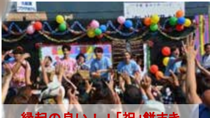
縁起の良い！！「祝」餅まき