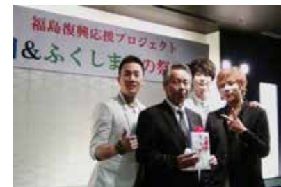
大震災と原発事故で町全体が避難された富岡町に支援物資贈呈