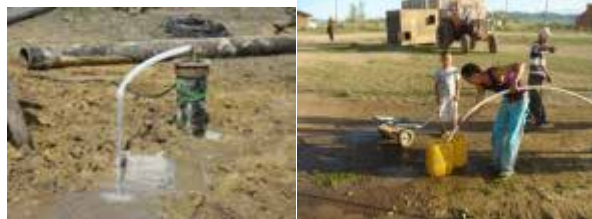
食水支援の井戸掘削活動