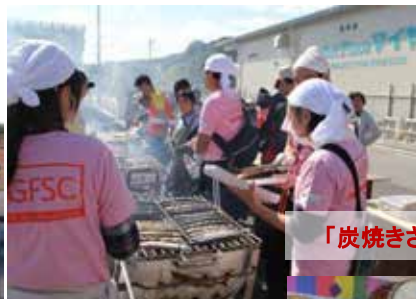
「炭焼きさんま」美味しく焼き上げます