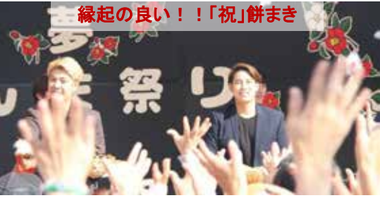
縁起の良い！！「祝」餅まき