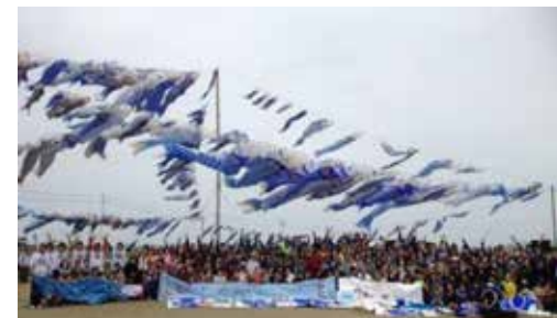
絆を未来に広げよう！また来年会いましょう