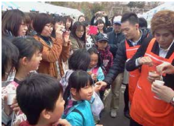
福島の食の安全をアピール