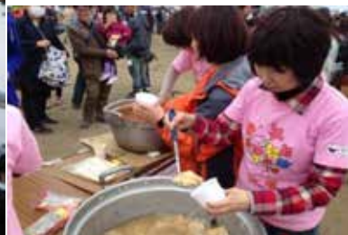
韓食“トッポッキ”と“おでんスープ”炊き出し