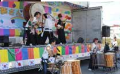
宮城県石巻市で当法人と一緒に支援活動を歩んできた3Dファクトリー所属。復興志縁和太鼓プロジェクト「福面」の演奏が心に響く