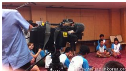
いじめに対して日韓の高校生が真剣に取り組む姿をNHK,KBSなどが取材した