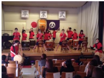
当NPO法人が特別に雄勝中学校に贈呈したオリジナル曲“ねがい～たくましく生きよ～”

“3年間を振り返って”との卒業生の発表では、ある生徒は“太鼓との出会いが1番の思い出だった”と、そしてある生徒は“行けると思わなかった韓国に行け、交流を持てたことが最も良い思い出！”と語った。