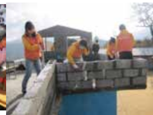
図書館は小さくても希望は大きい