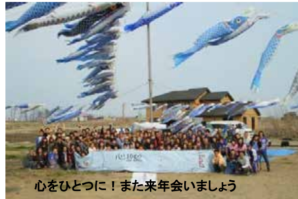
心をひとつに！また来年会いましょう