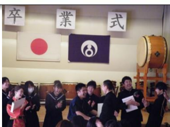
笑顔いっぱい3年間共にした友人と語り合う雄勝中の子供たち