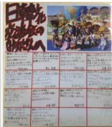
当NPO法人への感謝の寄せ書き

“3年間を振り返って”との卒業生の発表では、ある生徒は“太鼓との出会いが1番の思い出だった”と、そしてある生徒は“行けると思わなかった韓国に行け、交流を持てたことが最も良い思い出！”と語った。