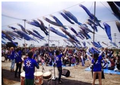
故郷の太鼓に心を癒す

大きな災害の後に見出せた人の絆は復興への原動力だ。応援に集まった人々もまた、大きな力を貰った一日であった。