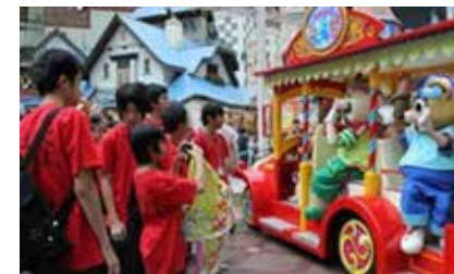
ロッテワールド で楽しい時間