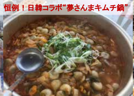
恒例！日韓コラボ“夢さんまキムチ鍋”