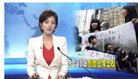
多くの日韓のメディアがこの行事取材しながら、今すぐ困難な日韓関係を超え、今こそ民間交流の継続性の重要性を訴えた。