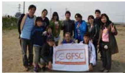
GFSCが支援している雄勝中学校の皆さんと再会の記念写真