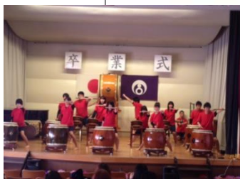
故郷伝統曲“伊達の黒船太鼓”