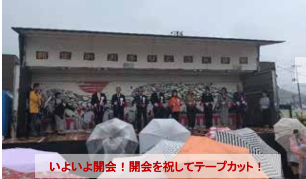
いよいよ開会！開会を祝してテープカット！

2018.9.30 新夢商店街とキャッセン大船渡を会場に“夢さんまつり”のバトンを繋ぐ復興祭りが開催された。震災復興が進み仮設夢商店街の撤去が決まり、震災後2011年12月より苦楽を共に歩んできた仮設夢商店街は、2017年4月29日に新夢商店街とキャッセン大船渡に分かれ新たな道を進む事となった。6年にわたり地元大船渡地域住民と縁を繋いできた当NPO法人は、今年2018年、この縁深い2つの商店街と手を携え、5回目の復興祭りの企画・開催に至った。