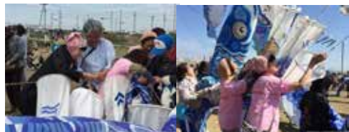
前日までに掲げられてた500匹の鯉のぼりに、当日300匹余りの鯉のぼりの掲載を手伝い、今年は800匹を超える鯉のぼりが天高く晴天の大空を元気に泳いだ。