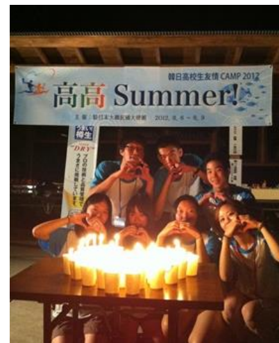
良い友だちになりましょう！と誓う日韓高校生たちーキャンドルセレモニー