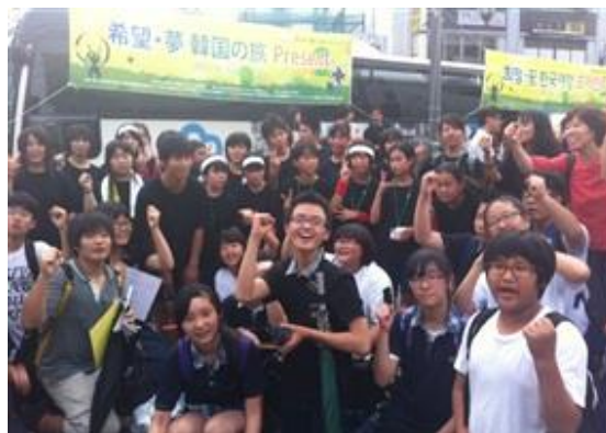
日韓文化交流によって私たちは友人になりました！

雄勝中学校全生徒は今回の希望・夢韓国の旅プレゼントによって津波の記憶に美しい友情の花が咲いた。