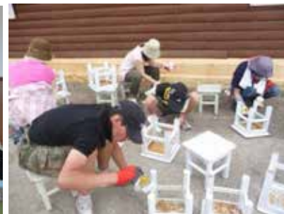
幼稚園の 環境改善 活動

モンゴル、ウランバートルの劣悪な教育環境であるチンギルテ地域で貧困層の子供たちのためにアフタースクール運営に支援。