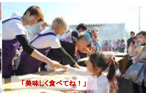
「美味しく食べてね！」