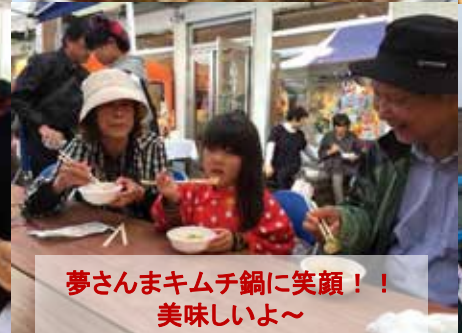
夢さんまキムチ鍋に笑顔！！ 美味しいよ～