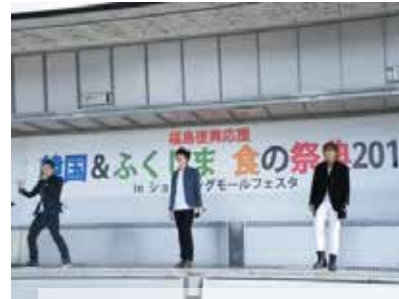
4月の雪舞う中渾身の力を込めて歌うGFSC広報大使 FIX