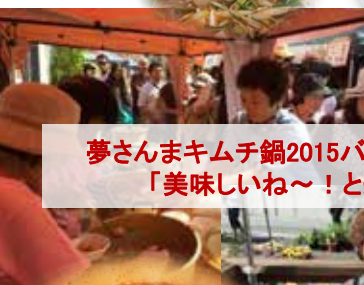
夢さんまキムチ鍋2015バージョンに「美味しいね～！」と絶賛！