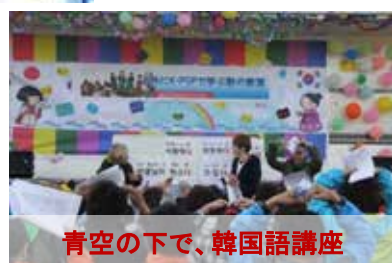
青空の下で、韓国語講座