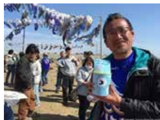
会場に訪れた参加者に声掛けし集まった“青い鯉のぼりチャリティー募金”を全額寄付