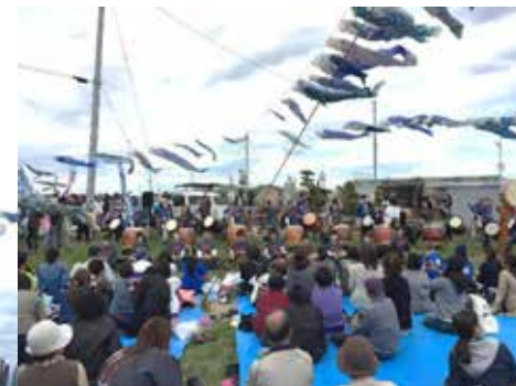
宮城県内陸、沿岸部の太鼓チーム、歌手が参加。太鼓の音色はふるさとの大地に轟き、歌声は天に届くかのように弾む。