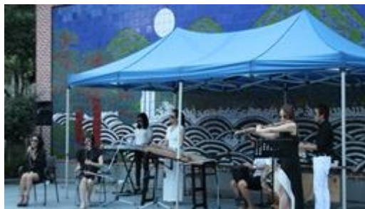
韓国仁寺洞広場での日韓の伝統楽器交流が 来た歴史的な日韓交流公演