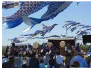
宮城県の太鼓チーム演奏はふるさとの大地に轟いた