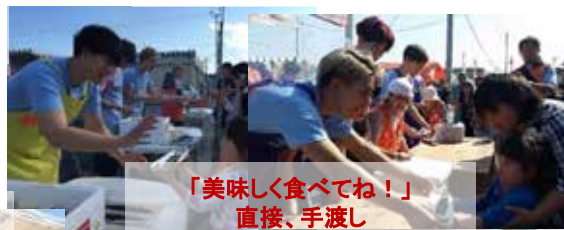
「美味しく食べてね！」直接、手渡し