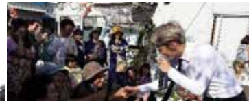
GFSC広報大使 MR.MR 無料チャリティーライブ！