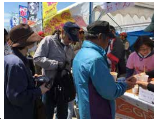
今年の炊き出しメニューは韓国おでんと甘辛餅のトッポギ。韓国食の食文化交流も6年目を迎え地元でもすっかりお馴染み！各200食も瞬く間に完食！！

当NPO法人日韓文化交流会札幌・東京スタッフ及びボランティア参加者で、今年も震災で亡くなった子どもたちの追悼、震災を風化させない決意、コミュニティ再生を目指し、予てより手を携える諸芸術団体と共に支援活動に爽やかな汗を流した。