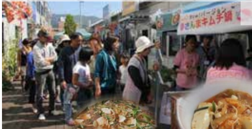
大型で脂ののった「炭焼きさんま」