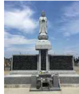
会場である萬寶院仮本殿の共同慰霊碑には震災で亡くなられた大曲浜地区1110名の方の氏名が刻まれている。震災から6年。月日を経ても大切な人への思いが変わることはない。

会場中央に立てられた高いポールを中心に放射線状に、外周にと渡るロープに、当日集まった支援者や参加者で更に鯉のぼりの追加掲載を手伝った。まるで地面から無数の青い鯉が天に向かい活きよい良く大空を昇るかのよう。