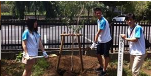
日韓高校生友情の木記念植樹 ～高麗神社～