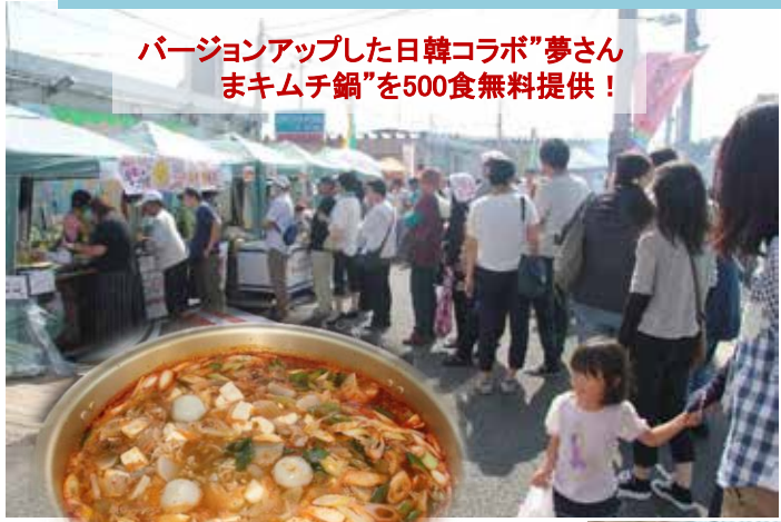
バージョンアップした日韓コラボ”夢さんまキムチ鍋”を500食無料提供！

2016.9.25 岩手県大船渡市茶屋町の仮設 夢商店街で“第4回夢さんま祭り”が開催された。夢さんま祭りは震災後岩手「大船渡市」地域住民(夢商店街)と文化芸術を通して東日本復興支援活動を推進するNPO法人日韓文化交流会とが連携して夢商店街の復興と活性化のために力を合わせて開催するイベントであり、今回で4回目となる。