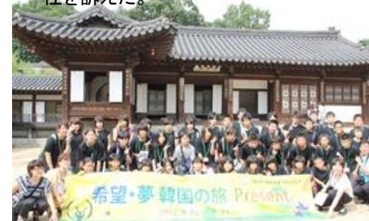
韓国の古宮である昌徳宮を観覧しながら歴史も勉強

雄勝中学校全生徒は今回の希望・夢韓国の旅プレゼントによって津波の記憶に美しい友情の花が咲いた。