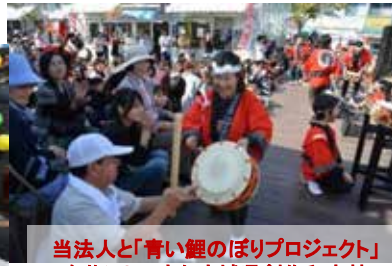
当法人と「青い鯉のぼりプロジェクト」を共にしてきた宮城県創作和太鼓“駒の会”和太鼓演奏で盛り上げる