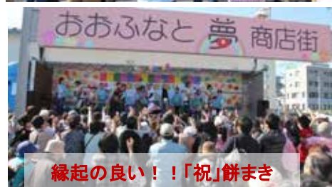
縁起の良い！！「祝」餅まき