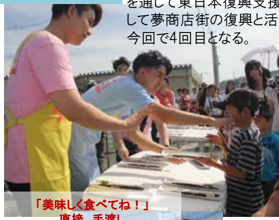
「美味しく食べてね！」 直接、手渡し