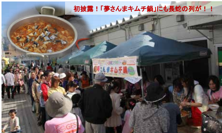
初披露！「夢さんまキムチ鍋」にも長蛇の列が！！

“夢さんま祭り”は“食”と“観光”と“音楽”を連携した、すなわち文化芸術を通した町興し・復興の第一歩と実感する一日になりました。