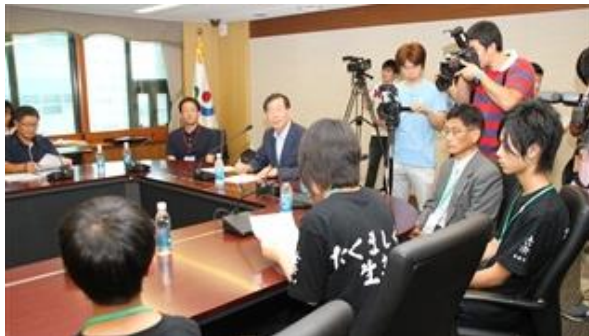
日韓関係が政治的には厳しいけれどこんな時こそ民間交流は大事であると語るソウル市長