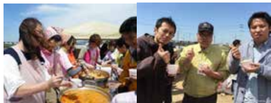
仮設住宅に暮らす皆さんにキムチ鍋とラップッキを炊出し。美味しいと好評頂き^^瞬間に各200食完食！！