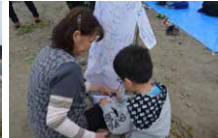
力を合わせて鯉のぼりをつなぐ