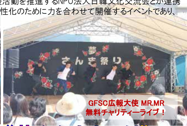
GFSC広報大使 MR.MR 無料チャリティーライブ！