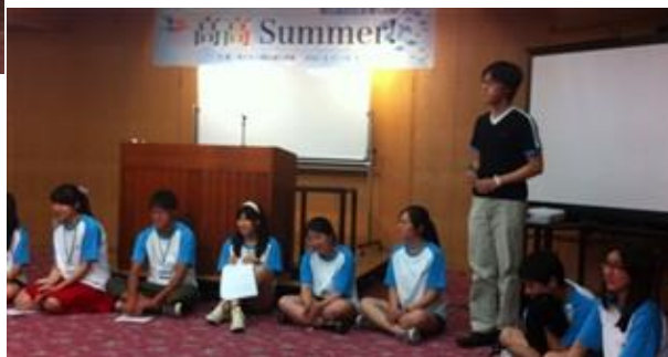
いじめに対する討論会