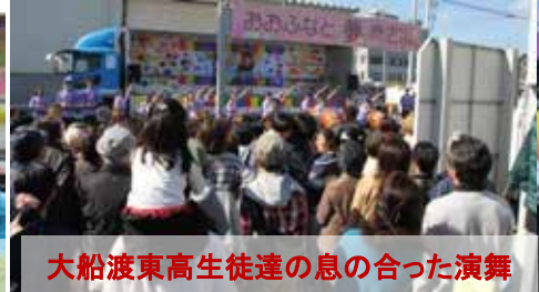
大船渡東高生徒達の息の合った演舞