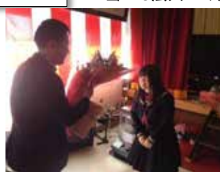
当法人へ感謝をこめて花束の贈呈

「太鼓が大好きです。」日韓さんから贈られたねがい～たくましく生きよ～の曲“が大好き”の言葉に続き、雄勝中学生として最後の太鼓演奏が行われた。太鼓という“よりどころ”を持つことで仲間と共に希望・夢に向かい、今は朗らかな微笑みに輝く卒業生の姿があった。