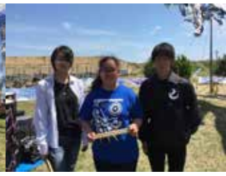
会場は例年、懐かしい再会の場