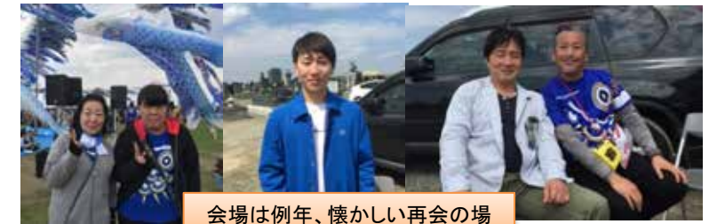
会場は例年、懐かしい再会の場

その風景はまるで大地から無数の青い鯉が天に向かい生きよい良く大空を昇るのように見えた。