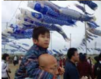
子ども達もたくさん参加