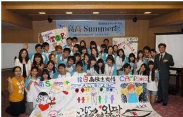
いじめは絶対ダメ！友情を深めよう。

2012.8.6～8.9 韓国大使館主催、当法人主管の日韓高校生による韓日高校生友情CAMP<高高Summer! 2012>において、両国は初めて最近社会的ニュースになっている日韓両国の共通の問題点「いじめ」をテーマに、実際いじめを受けた学生も多数参加し、専門家も交え討論、ロールプレイ、共同絵書き等により明るい未来・希望に向け交流をもった。両国の高校生は文化の違いの壁を、寝食を共にし、互いの言語を使う買い物体験や、言葉を必要としないダンスの練習等により文化の壁を乗り越え、さらに日韓友情を深めた