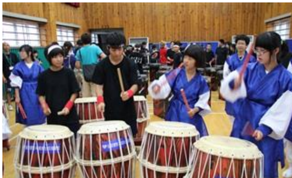
韓国三政中学校と日本雄勝中学校の学生たちはお互い太鼓を叩きながら交流し友情を深めた。