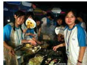
お互い焼いてあげるバーベキュー