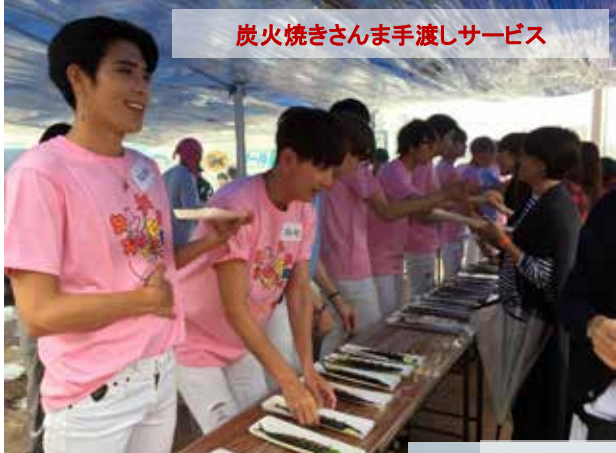
炭火焼きさんま手渡しサービス